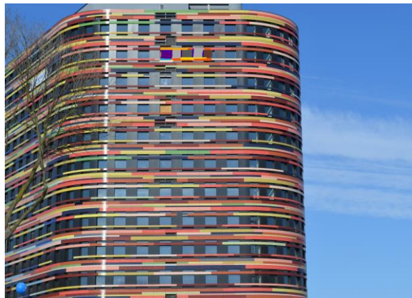
Behörde für Stadtentwicklung und Umwelt Hamburg