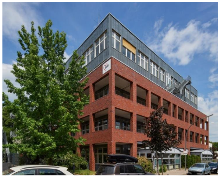
Haus Marie (Außenansicht)